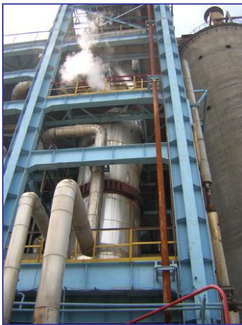
Ureum stripper in Roemenië

Een typische afzetting in een ureum stripper bevat ijzer III oxide (hematiet) met als bijmengsel nikkel-, chroom-, en molybdeenoxiden en is meestal grijs tot zwart van kleur. Het gevolg van deze afzetting is een verminderde warmte overdracht waardoor het productie proces minder efficiënt is.