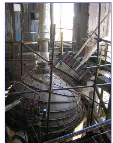
Bovenzijde van een ureum stripper in Iran

Op de 2 e pagina ziet u in grafiekvorm het verloop van een Ureum Stripper reiniging en een referentielijst van uitgevoerde ureum stripper reinigingen.