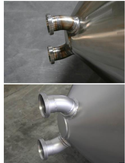
Voor en na