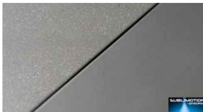
Rechts: behandeld met het SUBLIMATION-process® Links: behandeld met conventioneel parestralen

Hoewel het SUBLIMATION-process® belangrijke kenmerken deelt met het reguliere beitsen, zoals het verwijderen van lasverkleuringen en herstellen van de chroomoxidehuid, is het geen vervanging voor het reguliere beitsen. Het SUBLIMATION-process® is ontwikkeld om een oplossing te bieden indien er zeer specifieke eisen worden gesteld betreffende de afwerkingsgraad van materialen of constructies. Het beoogde resultaat kan enkel worden bereikt wanneer de te behandelen materialen zo perfect mogelijk zijn afgewerkt en gereinigd. Reeds tijdens het productieproces dient hier de nodige aandacht aan te worden besteed. Materiaalkeuze, ontwerp, bewerkingstechnieken en gebruikte lasprocessen zijn bepalend voor de