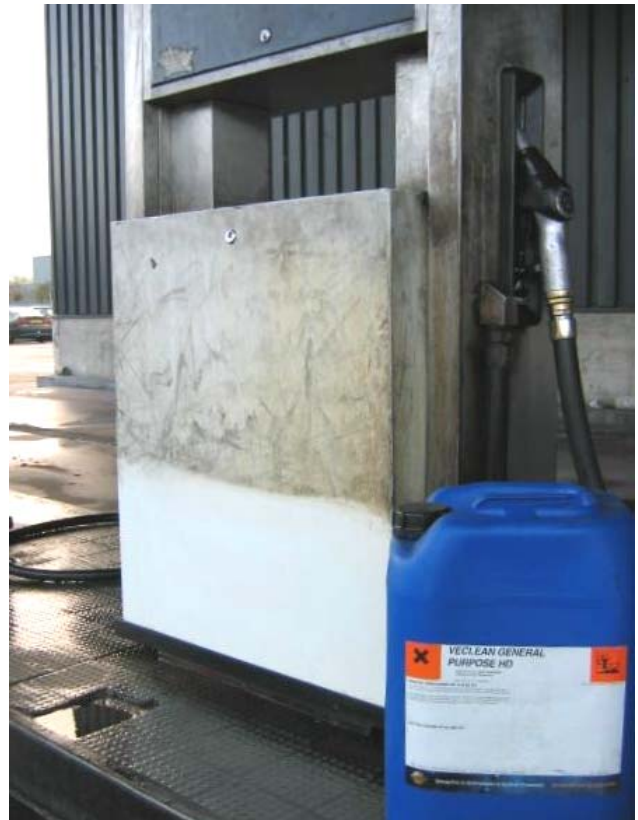
Gedeeltelijke reiniging met Veclean General Purpose HD

Bij elke verhoging van de temperatuur met 10 °C verloopt de reiniging 2 –3 x sneller. Voor het verwijderen van vetten geldt in het algemeen dat bij een temperatuur boven het smeltpunt gereinigd dient te worden.