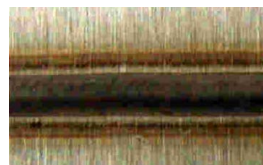
voor het beitsen

verbranding, te melden. Door te beitsen en te meten weet men zeker dat de warmtebeïnvloede zone, welke na het lassen verkleurd is, totaal verdwenen is. In tegenstelling tot formen, waar, veelal door haast tijdens het project, niet gewacht wordt tot het leidingsysteem volkomen zuurstofvrij is. Vooral bij grote leidingdiameters is het lastig, zo niet onmogelijk, om het gehele systeem volledig zuurstofvrij te krijgen. De zone naast de lassen blijft daardoor gevoeliger voor corrosie en eventuele infecties. Alleen door na het lassen het roestvast staal vakkundig te beitsen, is het mogelijk de corrosieweerstand weer op hetzelfde niveau te brengen als voor het lassen.