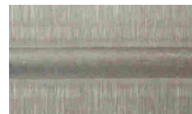
na het beitsen