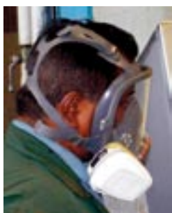
Draag bij voorkeur complete gelaatsbescherming.