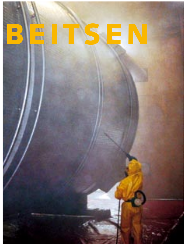
Het sproeibeitsen van grote objecten vergt een goede voorbereiding.

Controleer de kwaliteit van de sproeibeits, als deze dik is kun je in de meeste gevallen door middel van goed schudden of roeren de emulsie weer homogeen krijgen. Als de sproeibeits te dik blijft voor verwerking met een vernevel-