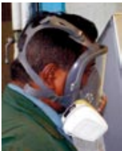
Draag bij voorkeur complete gelaatsbescherming.